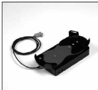
Mando de pedal