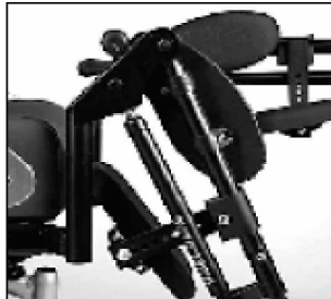
Reposapiés con regulación mecánica de altura