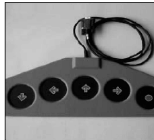
Módulo de teclas