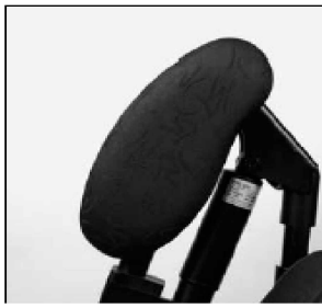
Acolchado lateral para piernas