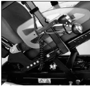
Basculación eléctrica de asiento