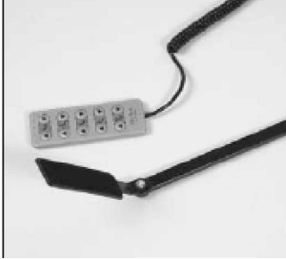
Módulo con teclas