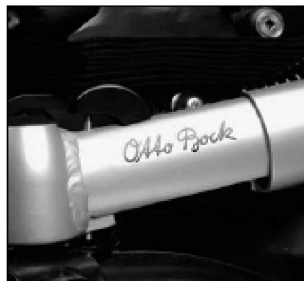
Bloqueo mecánico de dirección