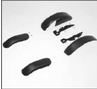
Protección contra salpicaduras