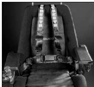
Cinturón de tirantes