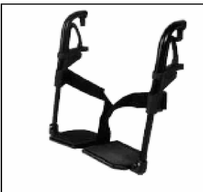
Reposapiés con placas de aluminio