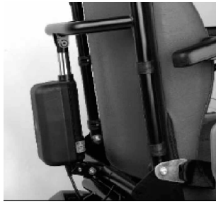
Basculación eléctrica de ángulo de respaldo