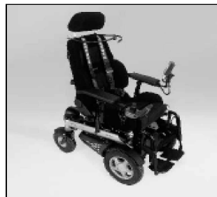
Mando por soplido/succión