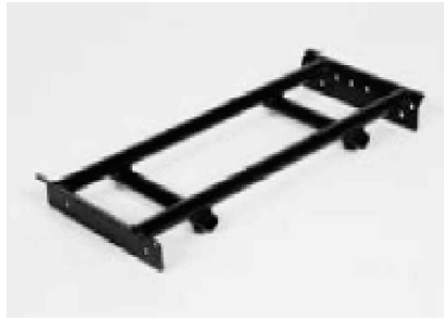
Adaptador intercambiable de "trapecio"