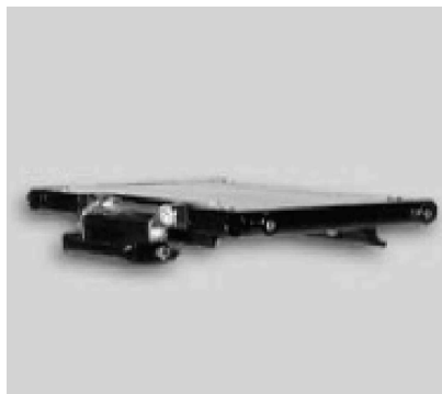
Soporte "paralelo" para órtesis de asiento