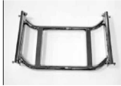
Adaptador intercambiable "paralelo"