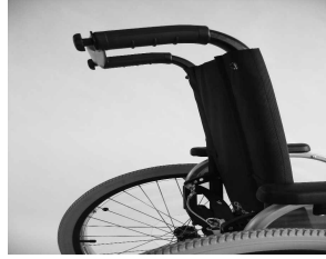
MD10 Ajuste ángulo respaldo a 30°