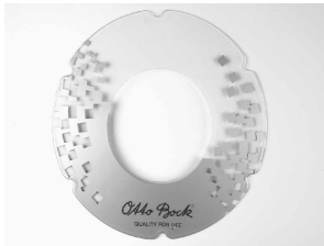
MG95 Cubrerradios decorado