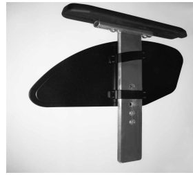
ME03 Pieza lateral desmontable