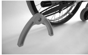
MA 62 Antivuelco pendular