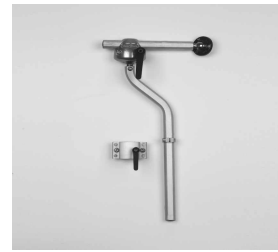
MZ55 Juego montaje multiaxial