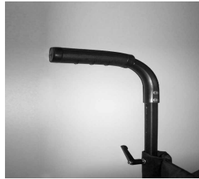
MD52 Manillar telescópico