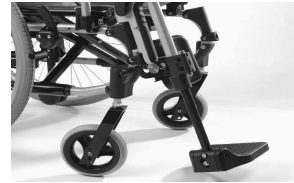
MD11 Reposapiés elevables