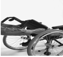
MD10 Respaldo partido