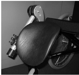
MB21 Apoyo de muñón para amputados