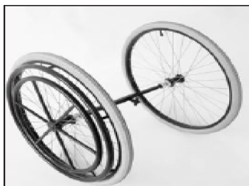
MG83 Accionamiento para una mano