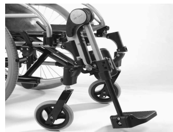
MD11 Reposapiés elevables