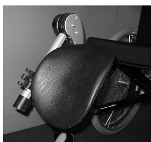
MB21 Apoyo de muñón para amputados