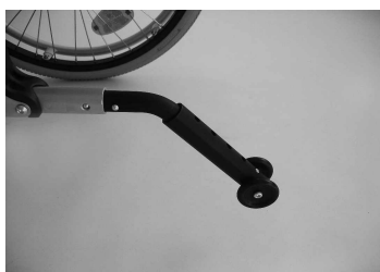
MA55 antivuelco escamoteable