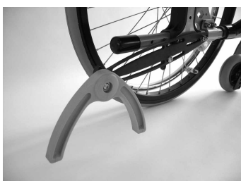
MA 62 Antivuelco pendular