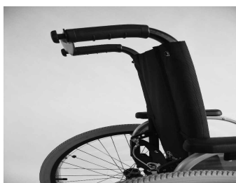
MD10 Ajuste ángulo respaldo a 30°