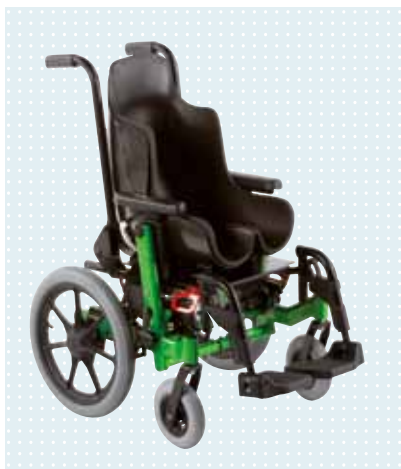
► tmax con asiento a medida