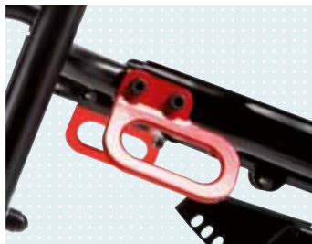
► Anclajes para transporte en VTD