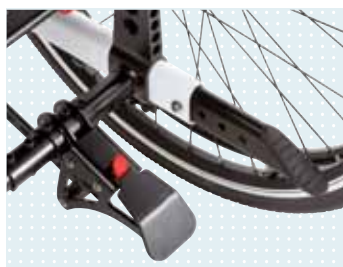
► Pedal para basculación