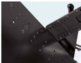
► Placa de asiento