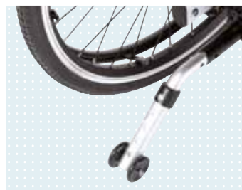
► Antivuelco escamoteable