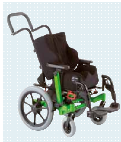
► tmax con asiento a medida