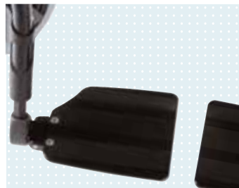
► Reposapiés de aluminio