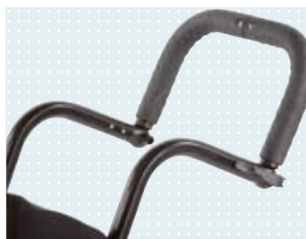
► Barra de empuje regulable