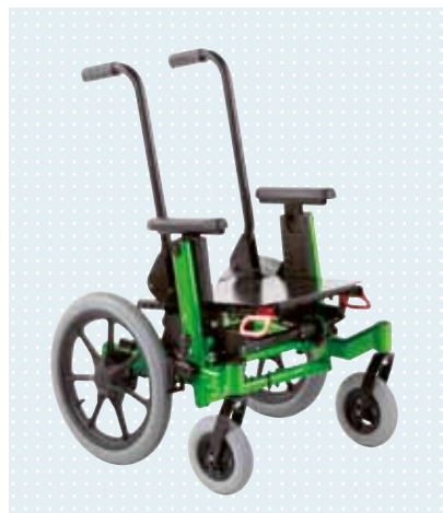
► tmax con placa de asiento